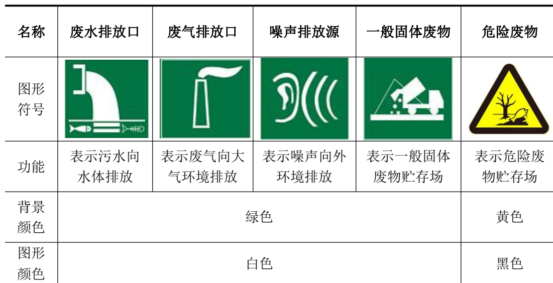
表 5-2 排污口规范化图标示意

建设单位应该在排放口处设立或挂上标志牌，标志牌应注明污染物名称以警示周围群众。图形符号见表 5-2。