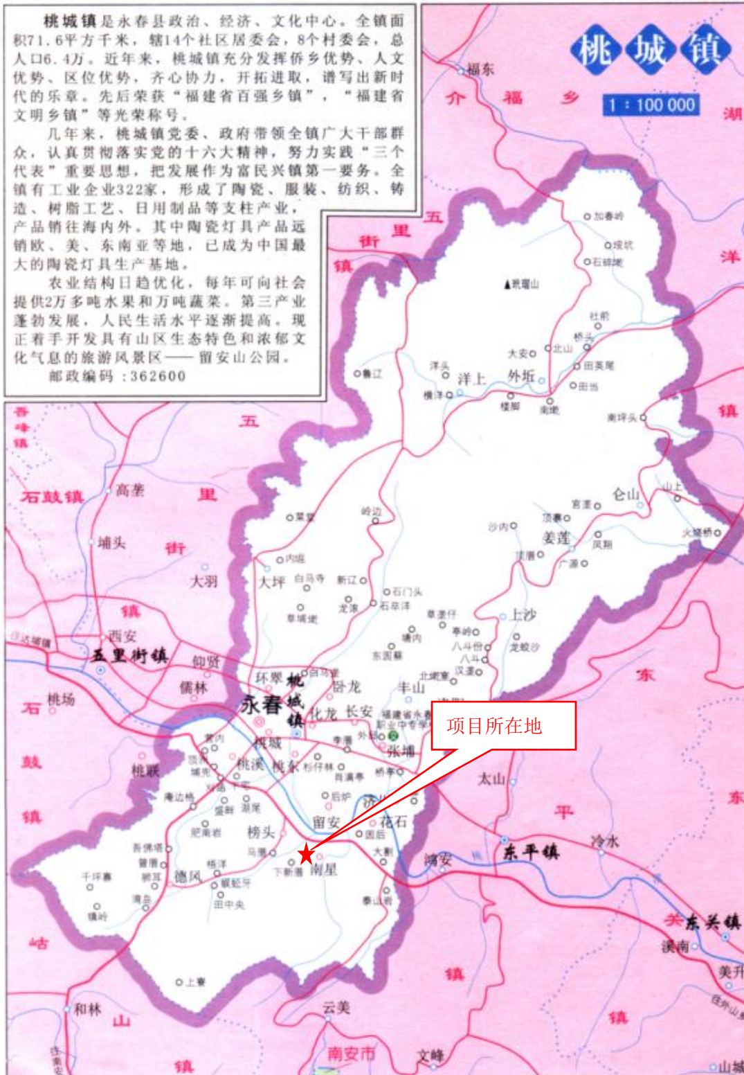
附图 1 项目地理位置